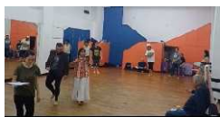
Escena Fedina 30 AGOSTO