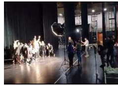
Sesión fotográfica en la Gran Sala