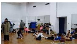
Ensayo Escena 1 Acto 1