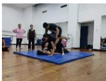
Escena Tortura Fedina