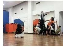
Figura E Fedina