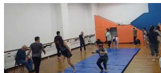
Entrenamiento corporal coordinación