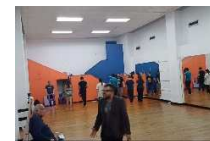
Escenas del II acto