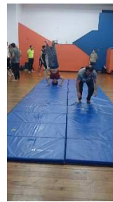
Entreno cohesión grupal