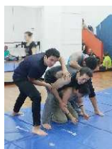
Escena Tortura Fedina