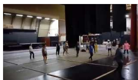
Reconocimiento Gran Sala