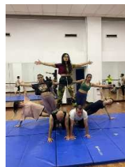
Escena tortura Fedina