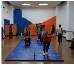
Entrenamiento corporal 30 DE JULIO