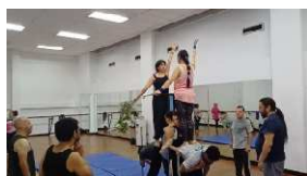
Prueba de figura E5 Acto II