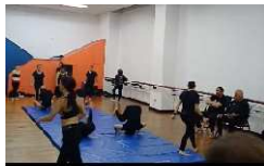
Entrenamiento corporal 29 AGOSTO