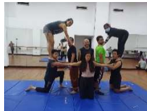
Prueba de figura