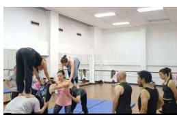
Prueba figuras corporales