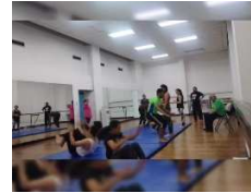
Escena segundo acto