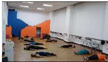
Entrenamiento corporal fuerza 27 AGOSTO