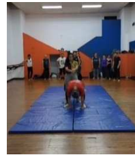
Entrenamiento fuerza y conexión