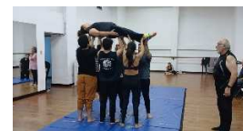
Entrenamiento confianza y fuerza