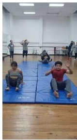
Entreno ritmo grupal