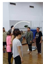
Escena 2 Acto 1