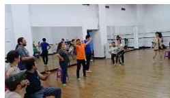
Ensayo Escena Dulce Encanto