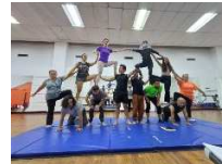
Figura Escena 05 II Acto