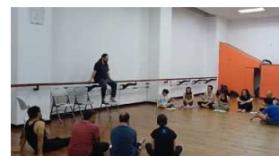
Entrenamiento rítmico y ensayo de Lumbre