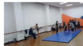
Entrenamiento en parejas