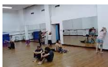
Ensayo segundo acto