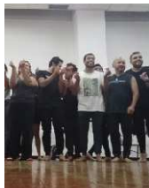
Escena Delirios Auditor