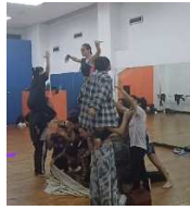
Figura E1 Acto I