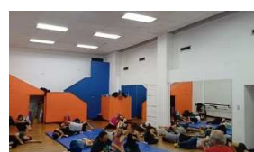
E1 Acto I