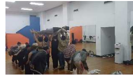
Detalles Escena 1 Sueño Lulo