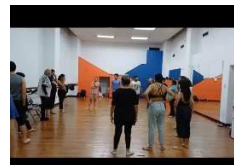
Entrenamiento de ritmo