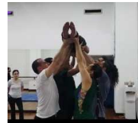
Entrenamiento confianza y fuerza