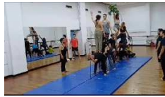
Figura de escena II acto