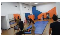
Entrenamiento fuerza extremidades superiores