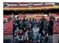
Breve reconocimiento a la Gran Sala