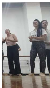
Escena segundo acto