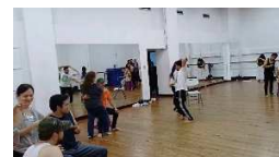
Escena E4 II Acto