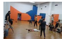
Ensayo Tortura Fedina