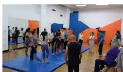
Prueba de figuras